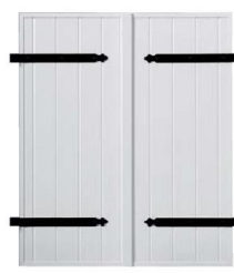
Pentures, vue extérieur